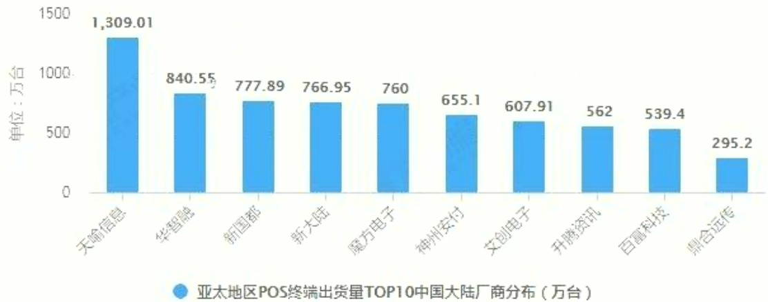
2019年亚太地区POS终端出货量TOP10中国大陆厂商分布情况